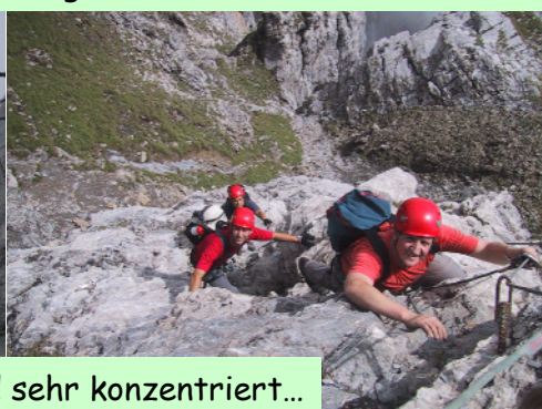
Einige sind sehr konzentriert...