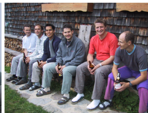
...das Ziel auch