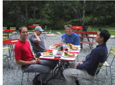
Stärkung vor dem Start