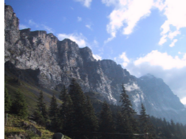
Unser Ziel in der Mitte des Bildes.