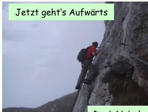
Jetzt geht's Aufwärts