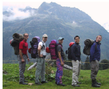
Komplett ausgerüstet, bereit für steile Felswände.