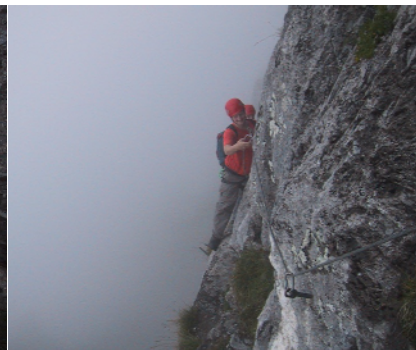
Dank Nebel geht's nicht so weit nach unten